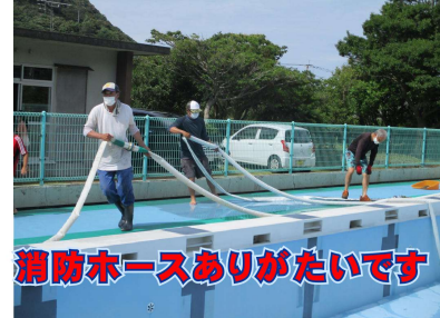
消防ホースありがたいです

5月20日(木)は、プール掃除を行いました。14名の保護者、2名の元保護者、1名の地域の方のお手伝いをいただき実施することができました。子供たちは、きれいになったプールで楽しく水泳授業ができています。ありがとうございました。