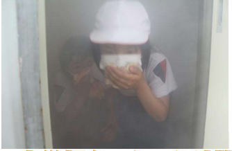
火災煙をつかった避難

5月8日(土)に火災・地震・津波避難訓練を10日(月)に大雨による集団下校訓練を実施しました。南海トラフ大地震や集中豪雨などの危険が高まっていますが、もしもの時に命を守るための行動ができるよう、今後も訓練に臨みたいと思います。