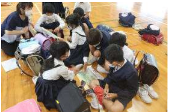
避難の仕方を話し合う