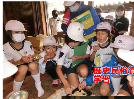
歴史民俗資料館で体験学習